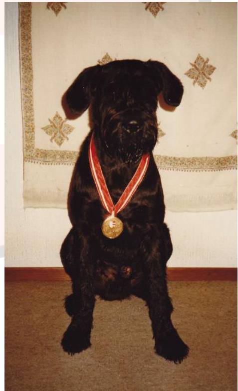
mit Lord Wanderpreissieger 1986 im BH1