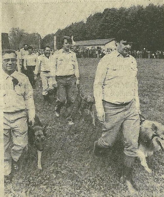
Die Uebungen der Ustermer «Hündeler» wurden von einer stattlichen Zuschauermenge verfolgt.

Im Jahr 1972 führte man erstmals einen öffentlichen Erziehungskurs für Hunde und Hundehalter durch. Wegen des grossen Erfolges wurden die Kurse jeweils jedes Jahr wiederholt. Die Teilnehmerzahlen steigen stetig (1976: 45 Teilnehmer), und die Kursteilnehmer bestätigen immer wieder, dass der Verein mit seinen Kursen ein echtes Bedürfnis befriedigen kann.