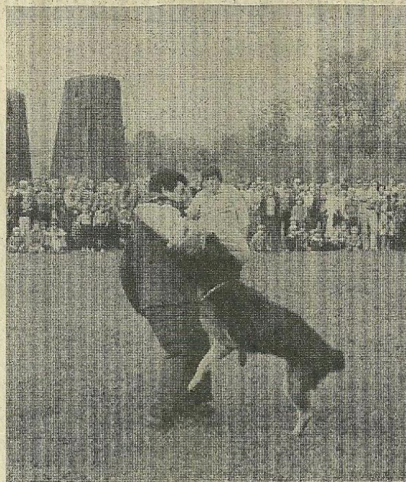
Der Polizeihund hindert den «Verbrecher» durch Biss in den Arm an der Flucht.

Am Boden spielte sich nun aber eine interes-